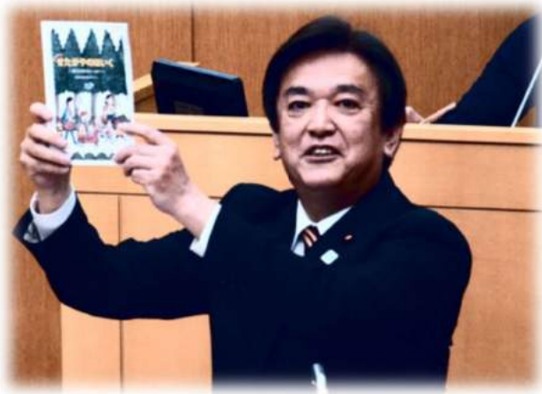
平成29年第4回定例会本会議質問 世田谷区の「保育の質ガイドライン」を掲げて！