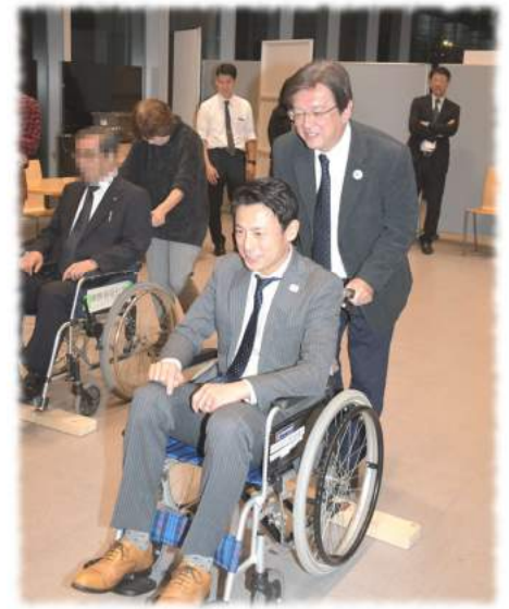
昨年12月4日、第1回「ハートクルー」 養成講座に参加

千代田区として、平成28年10月に「千代田区障害者の意思疎通に関する条例」を定め、障害者の方がもつ障害の特性に応じて合理的な配慮を行うことを決めました。とても大切な条例ができました。合理的な配慮とは、必要な配慮とは何か、誰もが正しく理解することが必要です。一番近くにいる隣近所の人や、