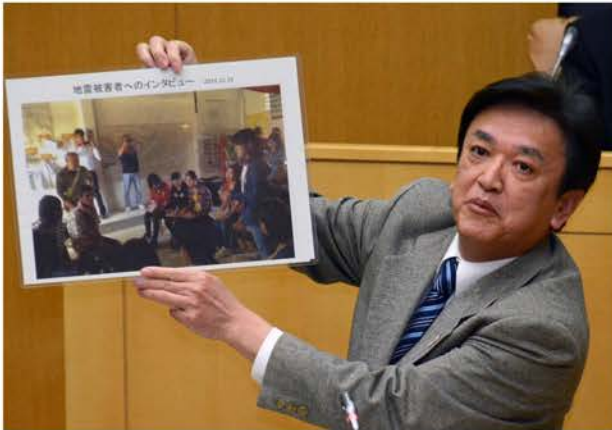
27年第1回定例会代表質問 地球市民ツアーのカンボジアでの写真を提示して